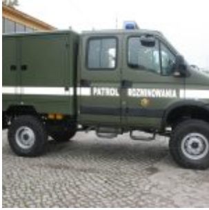
Pojazd saperski Topola