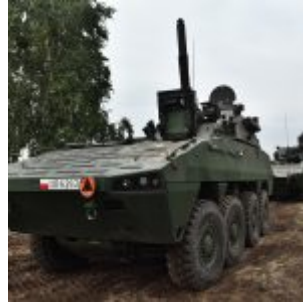
Moździerz samobieżny Rak