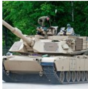
Czołg M1A1 Abrams