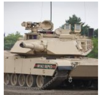
Czołg M1A2-SEP V3 Abrams