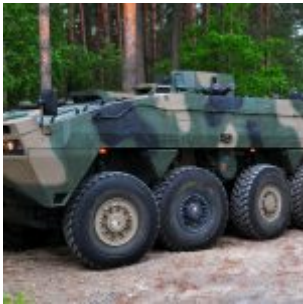
Artyleryjski wóz dowodzenia