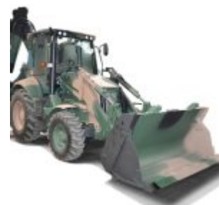
UMI - uniwersalna maszyna inżynierska