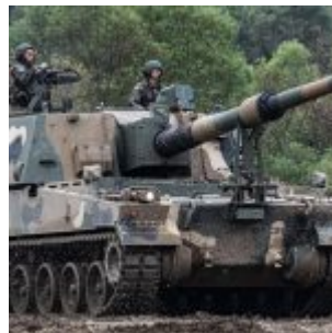
Armatohaubica samobieżna K9