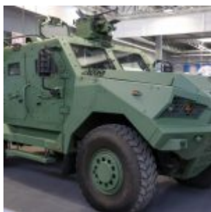
Opancerzony samochód terenowy Waran

Poniżej przedstawiamy zdjęcia sprzętu wojskowego, który zostanie zaprezentowany podczas pikniku;