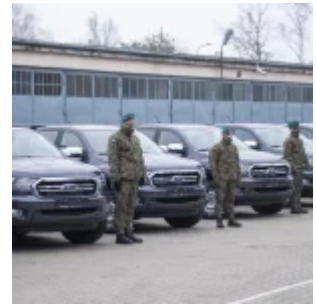
Samochód Ford Ranger